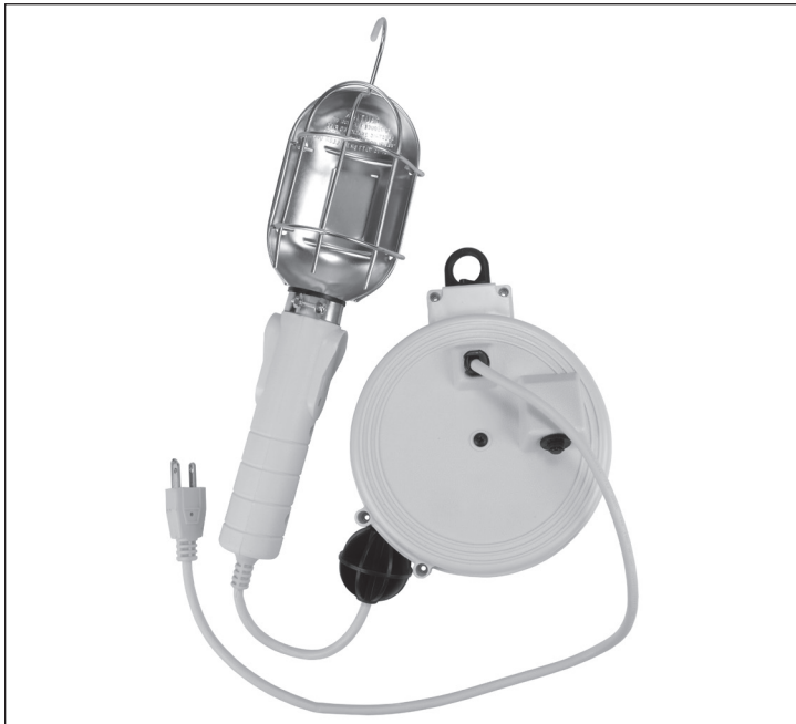
Electrical Rating - All models use 125 Volts 60 HZ

CAUTION - TO REDUCE THE RISK OF ELECTRIC SHOCK AND FIRE - PULL PLUG WHEN SERVICING CONNECTING/DISCONNECTING FROM THE CORD REEL OR WHEN RE-LAMPING — USE ONLY 75 WATT OR SMALLER BULB.