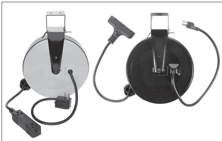
Electrical Rating - All models use 125 Volts 60 Hz

CAUTION - TO REDUCE THE RISK OF ELECTRIC SHOCK AND FIRE - PULL PLUG WHEN SERVICING, OR WHEN RE-LAMPING - USE ONLY 13 WATT OR SMALLER BULB