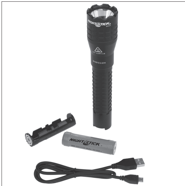
Included in the box - Compris dans la boîte - Incluido en la caja

Please read these instructions before using your 9854XL. They include important safety and operation information. Be sure to charge the 9854XL fully before the first use. A battery is fully charged when the charger light is green.